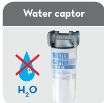
Water captor H 2 O