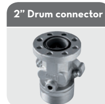
with integrated valve Code F17163000