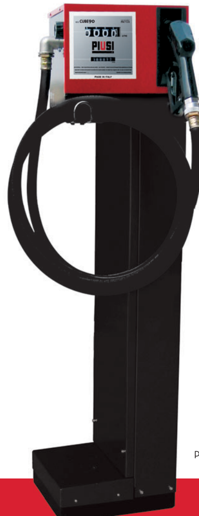
Pedestal on request