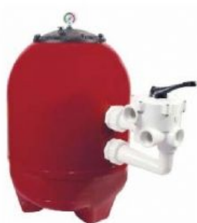
MODELO BR640 BR640 MODEL