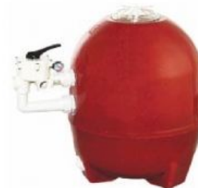
MODELO BL640 BL640 MODEL

(*) S.F.: Superficie Filtración F.A.: Filtration Area