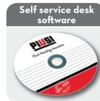
See "Fluid monitoring" section