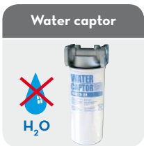
(only column versions)